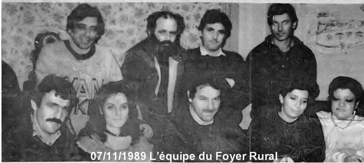
07/11/1989 L'équipe du Foyer Rural

1989 : Création du Foyer Rural de Cognin-les-gorges, qui succède au Comité des Fêtes.