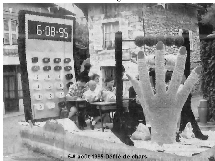
5-6 août 1995 Défilé de chars