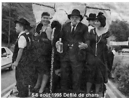
5-6 août 1995 Défilé de chars