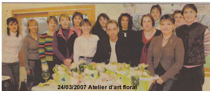
24/03/2007 Atelier d'art floral