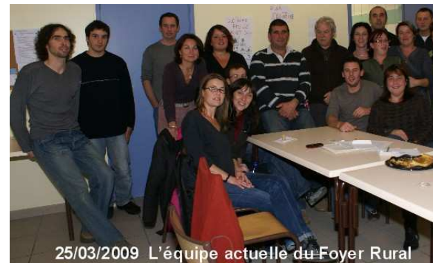
25/03/2009 L'équipe actuelle du Foyer Rural

L'équipe du Foyer Rural est ouverte à tous et à toutes propositions. Alors si des personnes cherchent à s'investir, elles seront les bienvenues !