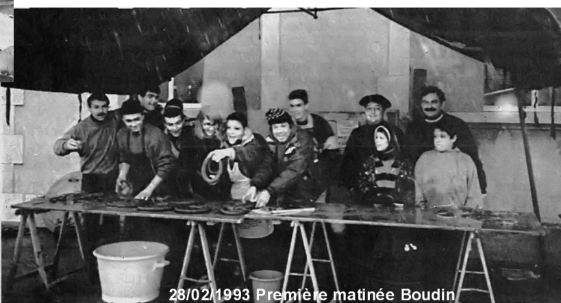
28/02/1993 Première matinée Boudin