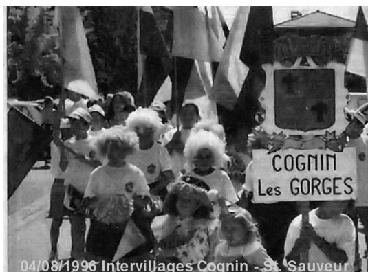
04/08/1996 Intervillages Cognin - St. Sauveur