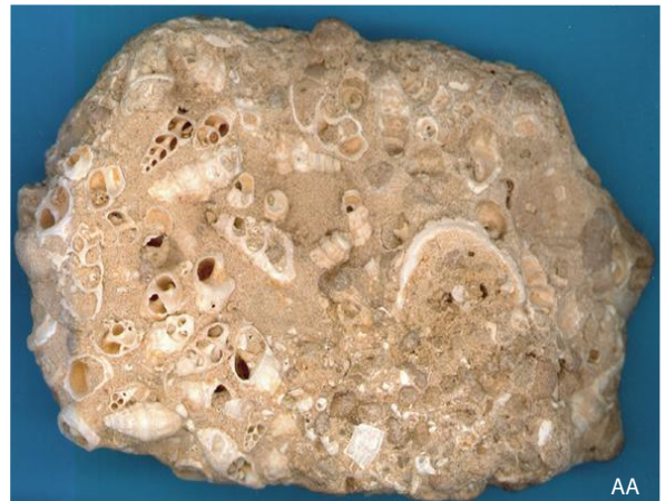
Dépôts de tempête sud-méditerranéens (Kerkennah, Tunisie) Les accumulations de gastéropodes sont toujours bien présentes

Texte - A Arnaud Vanneau