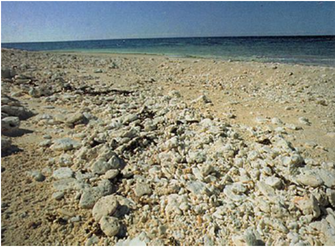
Dépôts de tempête tropicale à débris de coraux (Grande barrière, Australie)

Voici en exemple 3 types d'accumulations de tempête selon les latitudes :