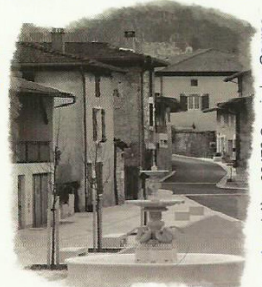
17 rue la tranière - 38470 Cognin les Gorges